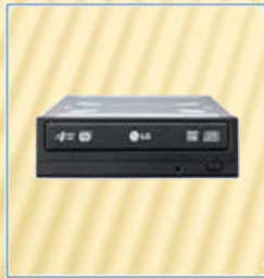
Gravador de DVD